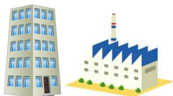
Adrese = Rīga (Centrālais birojs un Ražotne)