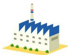
Adrese – Jelgava (Ražotne)